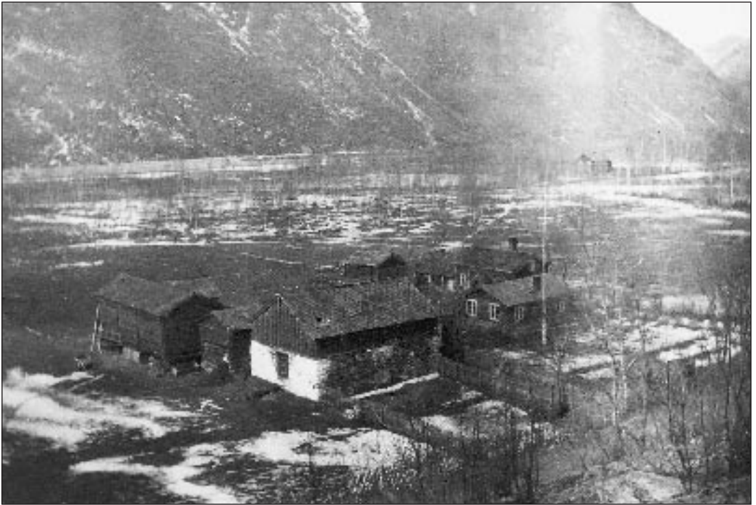
Ulvolden omkring 1920.