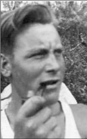
Ola i unge år