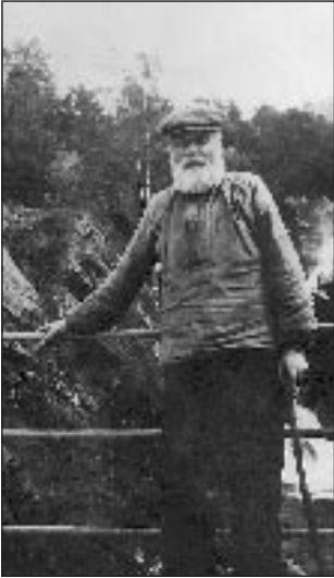
Gammel-Syver på Stampebrue.

2. To Kjør og 8 sauer fødes og stelles hjemme eller i Sæteren som Brugerens egne.