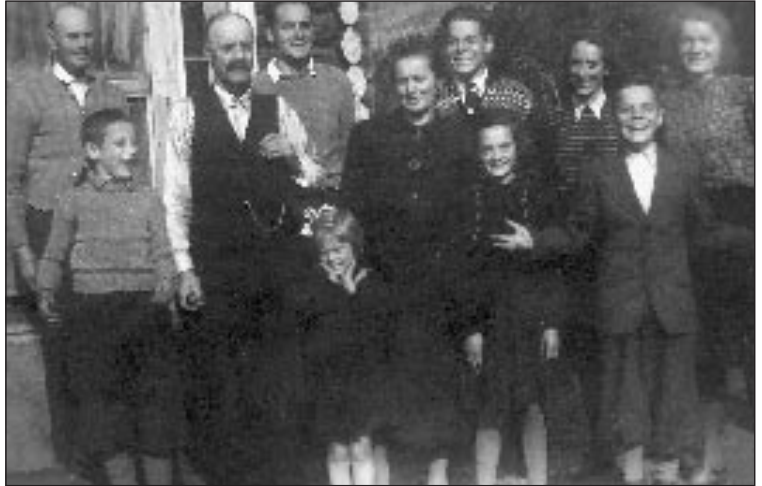
Familien på Ulvolden

hun tjente 15 kroner måneden. Seinere var hun bu-deie på setra i flere somrer.