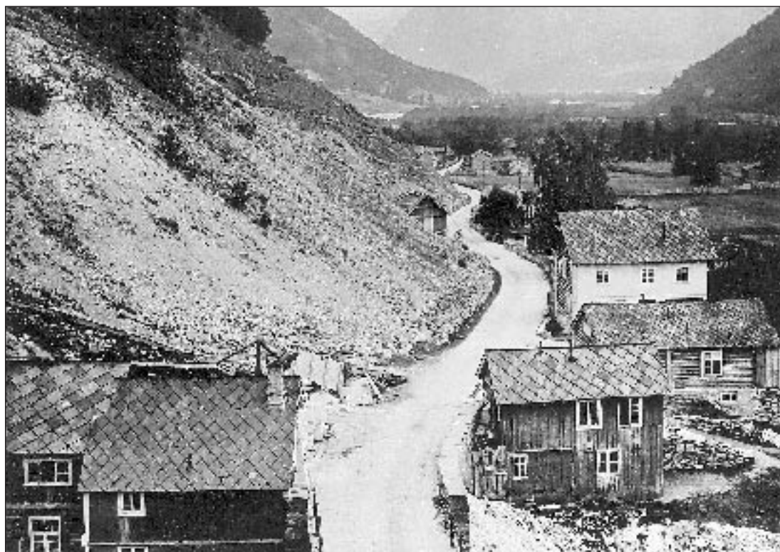
Selsverket, fra Stampen og sørover