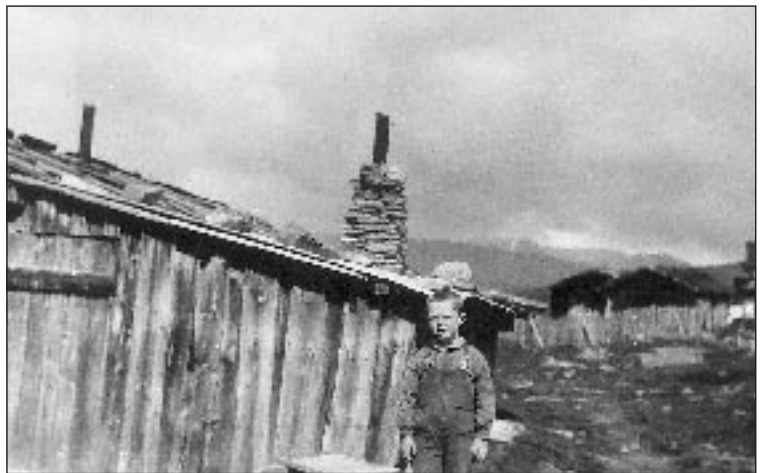
Engebret på Bottsetra.

Ut på sāmårn e 1946 vart e innkeila åt di militære, e va på Trandum ei stond før oss vart utti åt Tysklandsbrigadun. Oss va e Tyskland te utpå hauste e