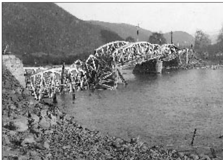
Otta jernbanebru ble sprengt sist i april 1940.

I Kvam kjempet engelske elitesoldater mot tysker-